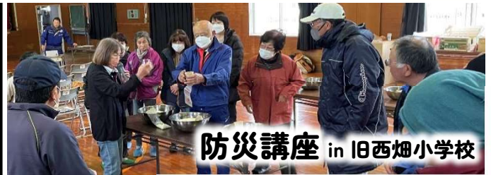
防災講座 in 旧西畑小学校

11/25(土)西畑地区にお住まいの方を対象に、美和地域自治会連合会との共催で開催しました。 日本赤十字社より講師を迎え、応急救護の方法、炊き出しの訓練を行いました。 近年多発する災害。今後いつ、どのような災害が起こるかは誰にもわかりません。 自身を守り、地域を守るにはどのような備えが大切なのか。皆さん真剣にお話を聞いておられました。