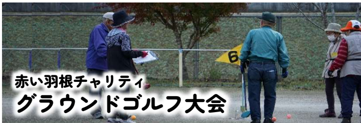
赤い羽根チャリティ グラウンドゴルフ大会

11/20(月)美川小中グラウンドにて赤い羽根チャリティグラウンドゴルフ大会が開催されました。 晴天の青空のもと、総勢約70人の参加者が日ごろの練習の成果を発揮しました。 今大会の参加費の一部は赤い羽根共同募金に寄付され、地域福祉に役立てられます。 たくさんのご参加ありがとうございました。