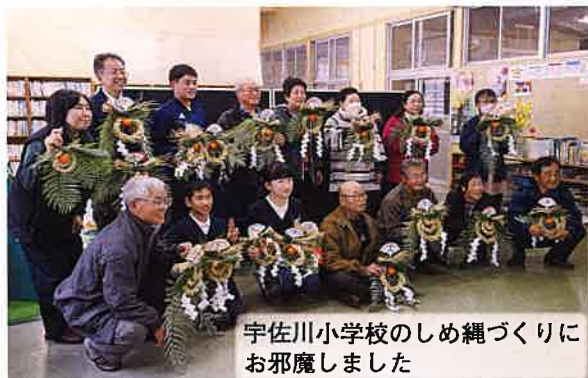
宇佐川小学校のしめ縄づくりにお邪魔しました