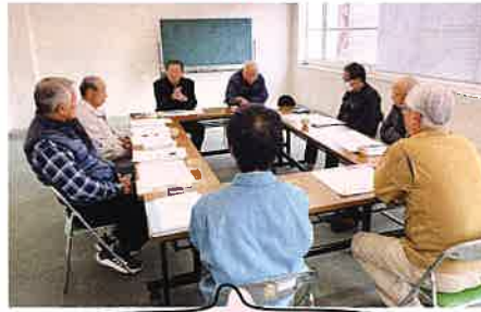
歳末配分委員会の様子です。活動状況の報告や配分先の決定を行います。