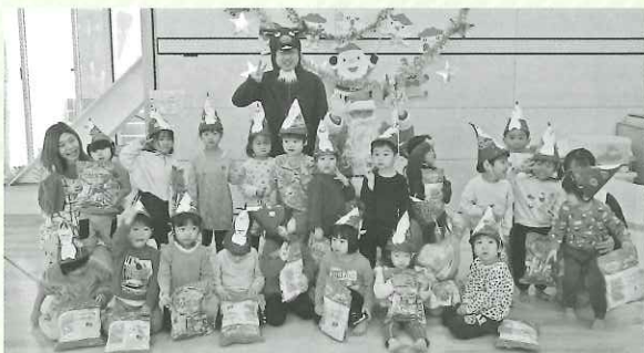
■ たかもり本陣保育園